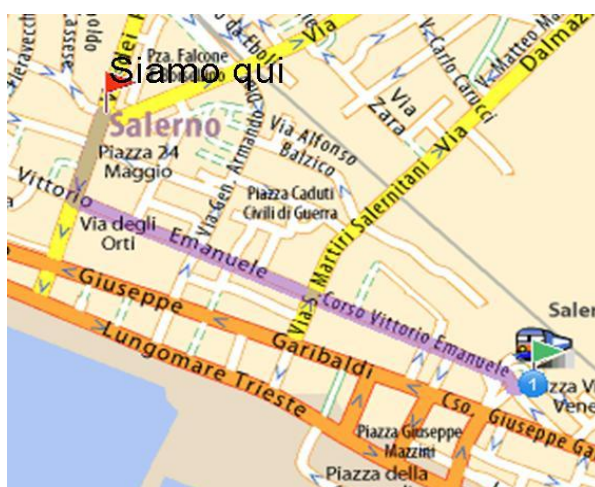
Figura 3: L'ubicazione Tribunale di Sorveglianza di Salerno

Il palazzo, negli anni '60, era sede del Magistero di Salerno. Attualmente vi sono ubicati, nella parte anteriore, alcuni uffici amministrativi della Corte di Appello ed il Tribunale e l'Ufficio di Sorveglianza di Salerno e, nella parte posteriore, il Liceo socio pedagogico "Regina Margherita".